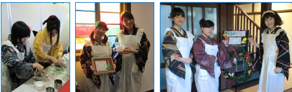
笑顔がステキでした！

明治10年に開業した菜香亭には、幕末をともに駆け抜けた木戸、伊藤、井上、後藤、佐々木の書があります。