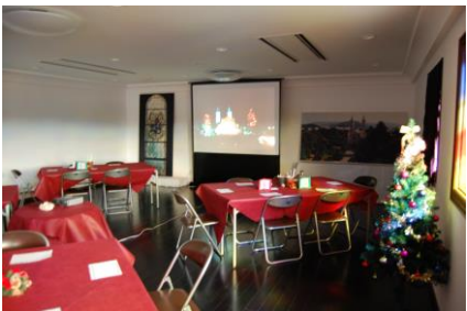
スクリーンに浮かぶ旧サビエル記念聖堂。しばし20年前にタイムスリップ。

お客様は旧サビエル記念聖堂のありし日の姿を観て大変懐かしんでおられ、かつて山口市のシンボルだった聖堂の存在の大きさを改めて感じ入りました。